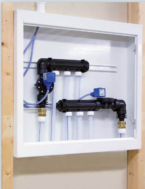
Kaksi venttiiliä jakotukeilla